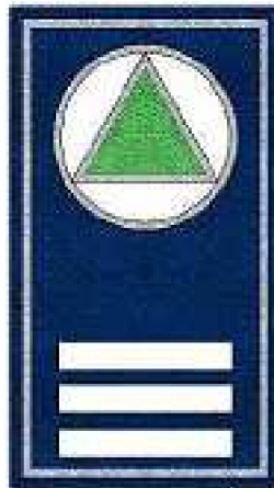
JEFE DE SECCIÓN