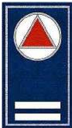
JEFE DE GRUPO