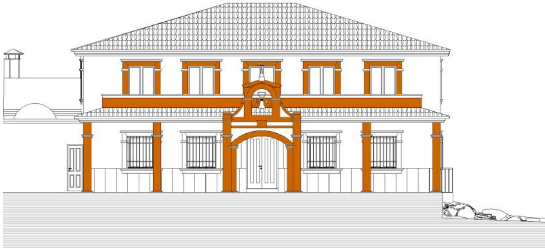
ALZADO PRINCIPAL A CRTA. SANTUARIO S/ ESTUDIO DETALLE