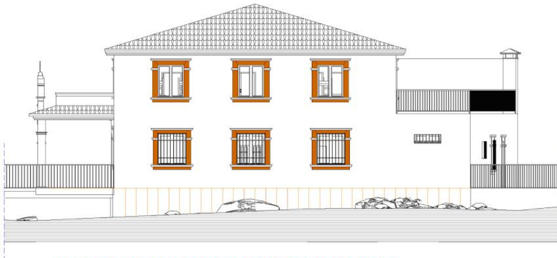
ALZADO A VIAL LATERAL S/ESTUDIO DETALLE